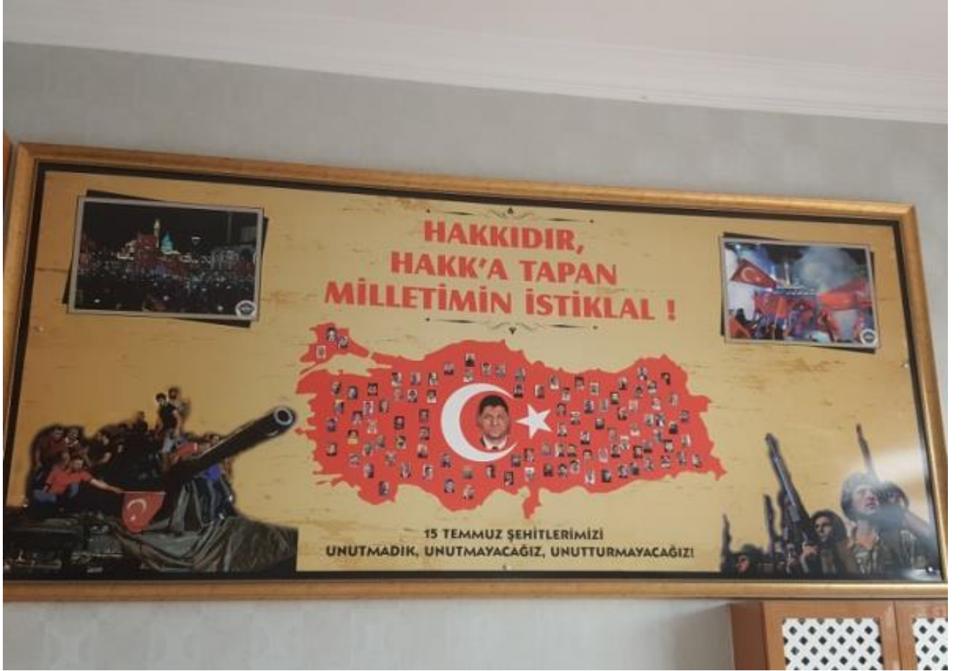
(15 Temmuz Köşemiz)