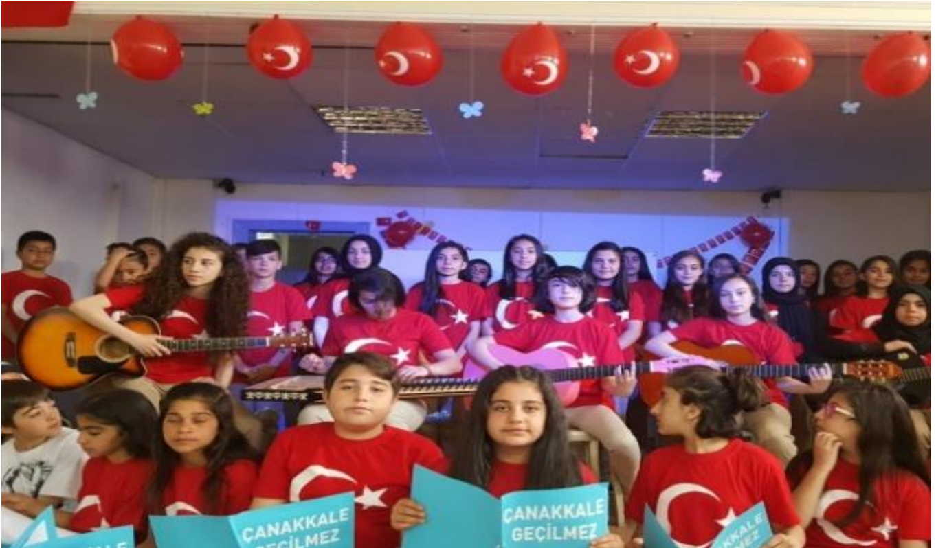
(18 MART ŞEHİTLER GÜNÜ ETKİNLİĞİ)

9- Öğrencilerimizde farkındalık oluşturabilmek için "Filistin'in Başkenti Kudüs", "Afrin' e Mektup" gibi etkinlikler düzenlendi. Milli Bayramlarımızda, önemli günlerde gerekli etkinlikler titizlikle yapılmıştır. 15 Temmuz konusunda öğrencilerimiz yıl boyunca bilgilendirilmiştir.